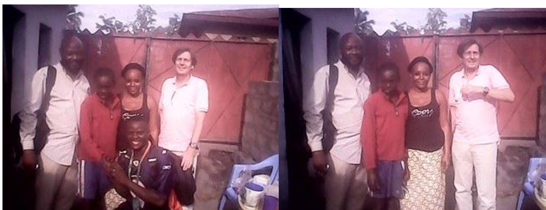
Les suivis familiaux renforcent la réunification de l'enfant en famille

Illustration d'une enquête de suivi d'un enfant réunifié en présence de l'évaluateur du projet