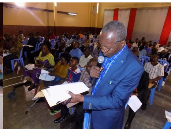
Participations aux différentes assemblées générales de la MUSECKIN où PECS assure le secrétariat adjoint.