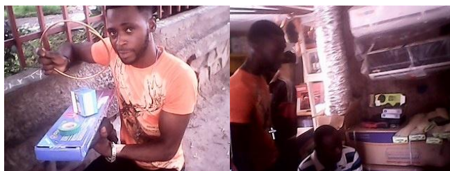
Kit pour électronique du froid kit

En dehors d'appui en AGR, 1 famille a bénéficié d'une garantie locative et 18 jeunes ont reçu des KIT de réinsertion trousse ou boîte d'outillage. Il s'agit en majorité des jeunes qui ont terminé la mécanique auto, la menuiserie et l'électronique du froid.