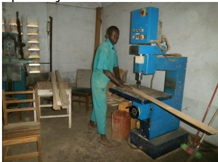
Stage à Ancris

2015 6 d'entre eux poursuivent leur stage à Don Bosco ou à l'entreprise Ancris. De plus 9 jeunes ont débuté leur formation en peinture