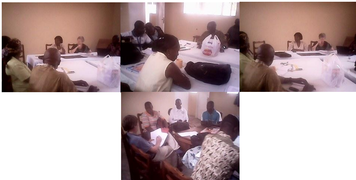
Lors des rencontres de l'équipe éducative

En interne les réunions d'équipe des éducateurs en présence du coordinateur du gestionnaire et du superviseur se sont intensifiées. Elles constituent un cadre de partage d'idées, d'application et d'évaluation pédagogique. Il s'agit d'une réunion technique de mise en commun des éléments objectifs concernant l'évaluation de chaque enfant ou groupe d'enfants. C'est une occasion de comprendre certaines situations et leur signification suivant les problèmes des enfants.