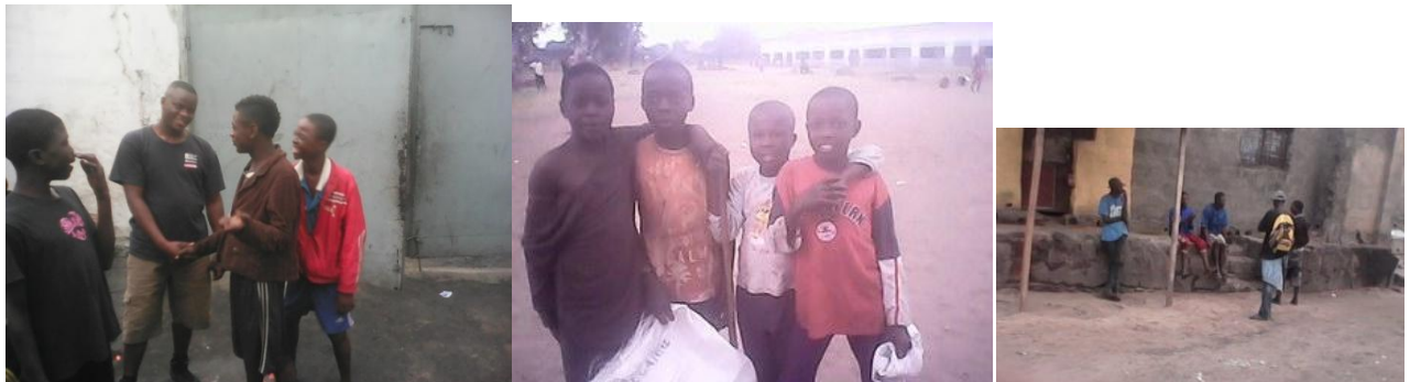
Images d'enfants dans un des sites exploités par PECS

4.3.2. Visiter les enfants du milieu ouvert dans leur milieu (sites):