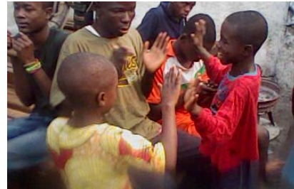
Activités culturelles le ballet, les sports (le Karaté ), le dessin, les jeux