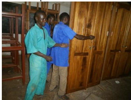
à Don bosco